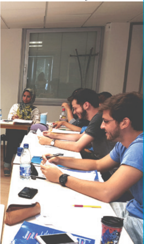
Cours de français de niveau A2

The Institute that makes you want to learn