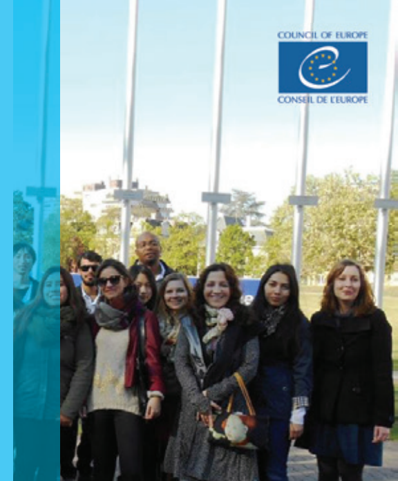
Visite au Conseil de l'Europe