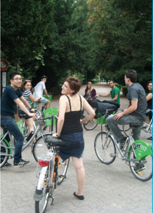
Tour de Strasbourg à vélo