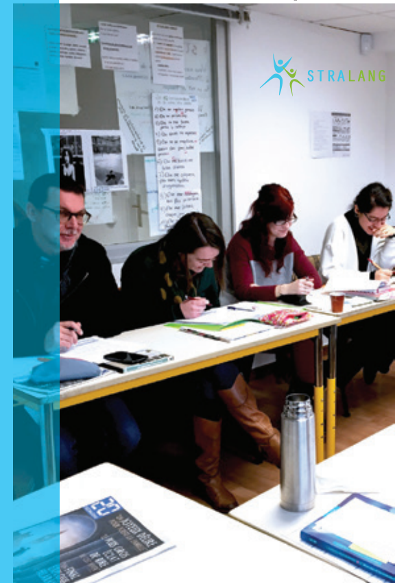
Français sur objectifs spécifiques (FOS)